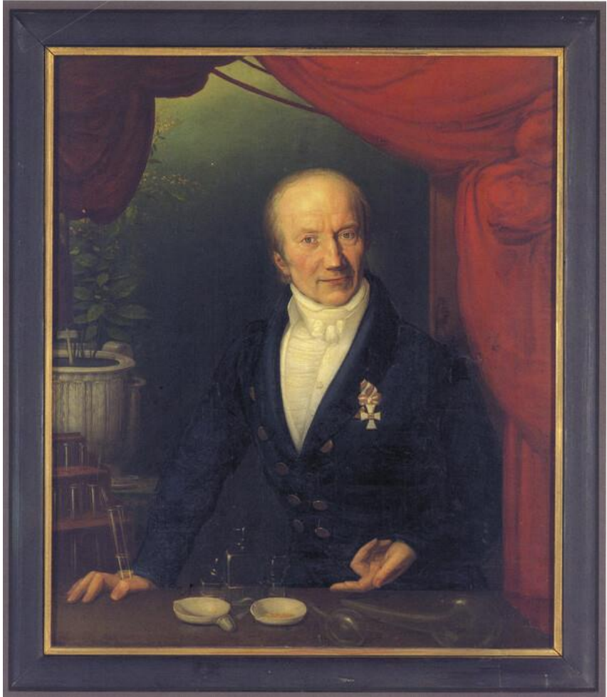
Johann Bartholomäus TROMMSDORFF (1770–1837)

Unsigniertes Altersbild im Besitz der Akademie gemeinnütziger Wissenschaften zu Erfurt